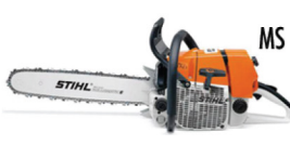
MS 441 CM