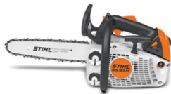
MS 193 TC-E

Las motosierras STIHL® para paisajistas, jardineros y servicios municipales son las más robustas. Con las motosierras de esta categoría solucionarás tu trabajo de la forma más efectiva: construir con madera, cortar leña o mantener los árboles en forma.