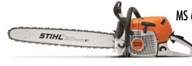
MS 661 C-M